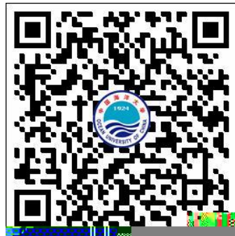
中国海洋大学校园统一支付平台二维码网址