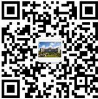
中国海洋大学财务处微信公众号